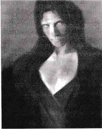
Fig. 1: Heru, fiul lui Aset și al lui Asar.

asupra mea și asupra învățămintelor de tot felul pe care mi le oferea, singurele garanții ale protecției sale în ochii mamei mele, Regina Tronului.